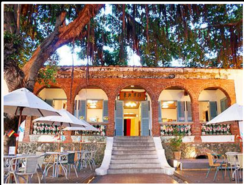
德商東興（三級古蹟） 免費