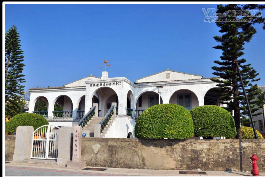
德記洋行（文化蠟像館，三級古蹟） 門票：全票50、半票25 台南市市民憑身分證免費

同治2年，外商紛紛於安平設立洋行， 德商東興、英商德記、怡記、和記、美商唛記，合稱安平五大洋行， 現在只剩下前面兩家洋行